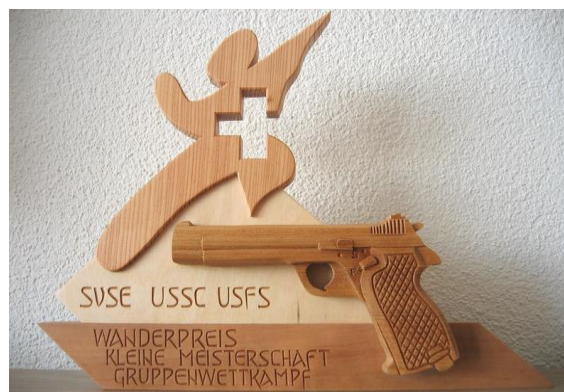
Wanderpreis Gruppe Pistole