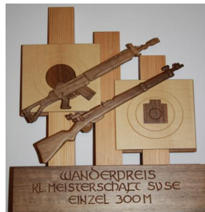
Wanderpreis Einzel 300m Neu seit 2011